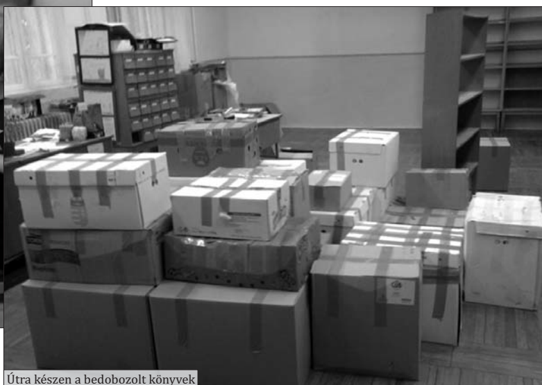
Útra készen a bedobozolt könyvek