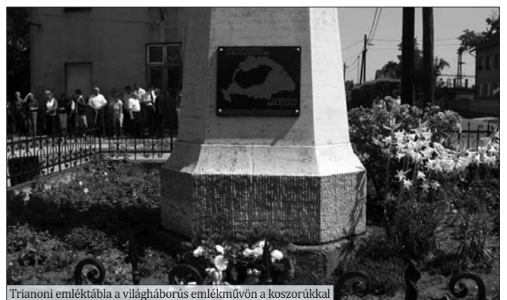
Trianoni emléktábla a világháborús emlékművön a koszorúkkal