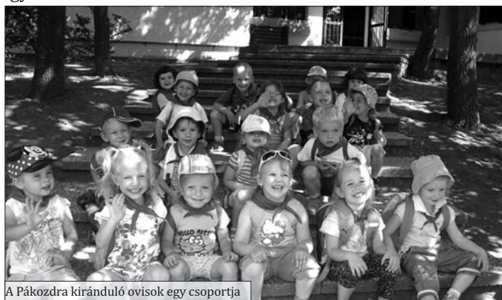
A Pákozdra kiránduló ovisek egy csoportja

Idén is elérkezett a nevelési év utolsó hete. Azért adtuk a fent említett nevet ennek a hétnek, mert a tanév folyamán is többször, de most különösen vártuk a szülőket, testvéreket, leendő óvodás gyerekeket, hogy lehetőség szerint vegyenek részt a tevékenységeinken. Minden napra jutott programból bőven, így senki sem unatkozott.