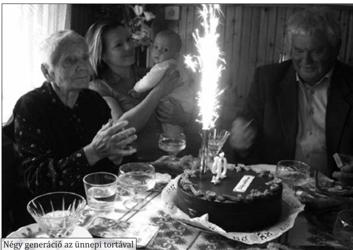
Négy generáció az ünnepi tortával