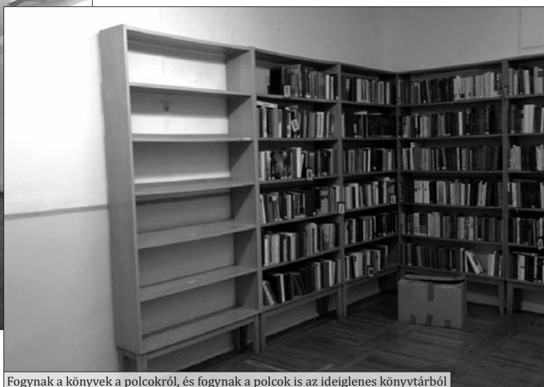
Fognak a könyvek a polcokról, és fognak a polcok is az ideiglenes könyvtárból