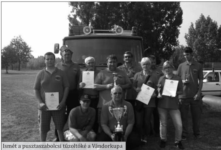
Ismét a pusztaszabolcsi tűzoltóké a Vándorkupa

Megyei Katasztrófa Védelmi Igazgatóság szervezésében nagyszabású vegyi-baleseti gyakorlat zajlott 2011. május 11-én a pusztaszabolcsi vasútállomás melletti közrako-dón. A gyakorlaton tűzoltó egyesületünk mellett több hivatásos egység, valamint a rendőrség, az OMSZ, a katasztrófavédelem vegyi felderítő csoportja, és a MÁV műszaki-baleseti, vegyi elhárító egysége vett részt. A gyakorlaton feltételezett balesetben egy tehergépjármű és egy veszélyes anyagot szállító tehervonat ütközött. Az ütközés következtében két személy súlyosan sérült, valamint a sérült teherszerelvényből veszélyes anyag szivárgott. A feladatot a fent felsorolt egységek összehangoltan kb. egy óra alatt hajtották végre.