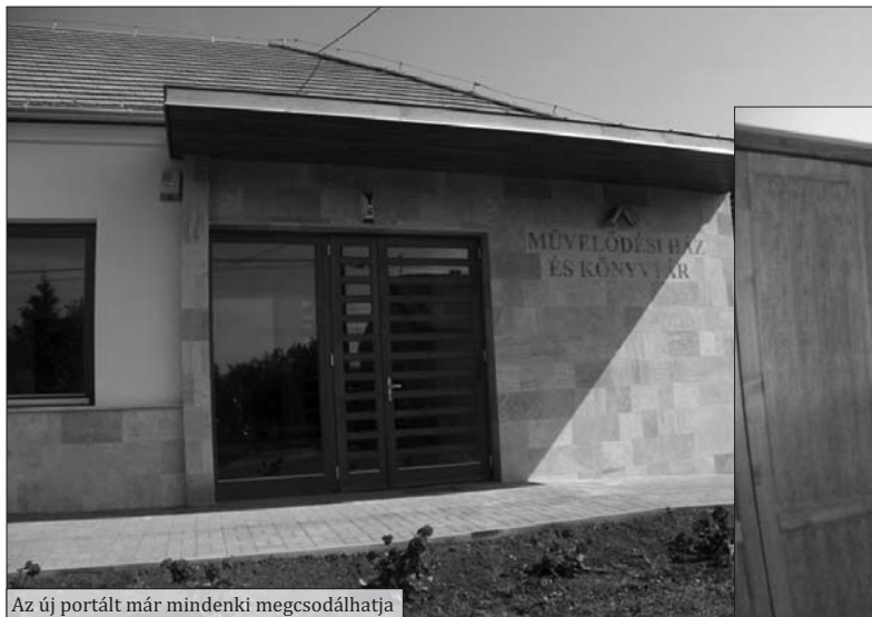
Az új portált már mindenki megcsodálhatja