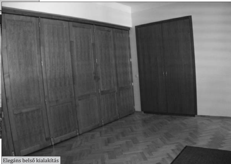
Elegáns belső kialakítás