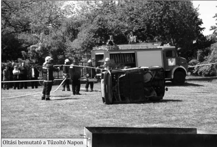
Oltási bemutató a Tűzoltó Napon

Önkéntes Tűzoltó Egyesületünk első ízben szervezte meg május 7-én a tűzoltó családi napot. A rendezvény zenés felvonulással vette kezdetét, melyen egyesületünk által meghívott tűzoltóságok, valamint társ szervezetek vettek részt. A sportpályán lezajlott rendezvényen tűzoltási-műszaki mentési bemutatót, a színpadon különböző programokat tekinthettek meg az érdeklődők, és élvezhették a FLÓRIÁN BAND koncertjét. A nap záró eseménye a hajnalig tartó utca bál volt. A szórakozás és a jó kedv után komolyabb dolgokat is tartogatott a május. A Fejér