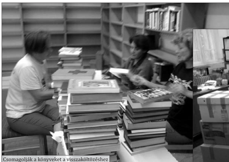
Csomagolják a könyveket a visszaköltözéshez