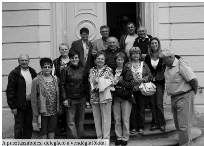
A pusztaszabolcsi delegáció a vendéglátókkal

Az immár több éve fenn álló német-magyar partnerkapcsolat keretében idén is látogatást tett egy delegáció Staufenbergben.