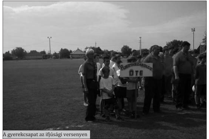
A gyerekcsoport az ifjúsági versenyen

21-én Székesfehérváron szervezett Fejér megyei tűzoltó-versenyen két csapattal, két kategóriában mérettük meg magunkat. Mindkét csapatunk jó szereplésének köszönhetően mindkét kategóriában első és második helyezést ért el, és a körzeti vándorkupa ismételen egyesületünk nagy termékét díszíti.