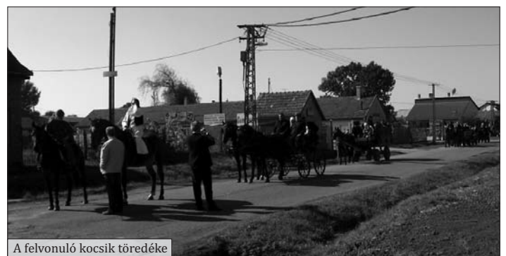
A felvonuló kocsik töredéke

A véleményeket összegyűjtötte: Csóri Barbara