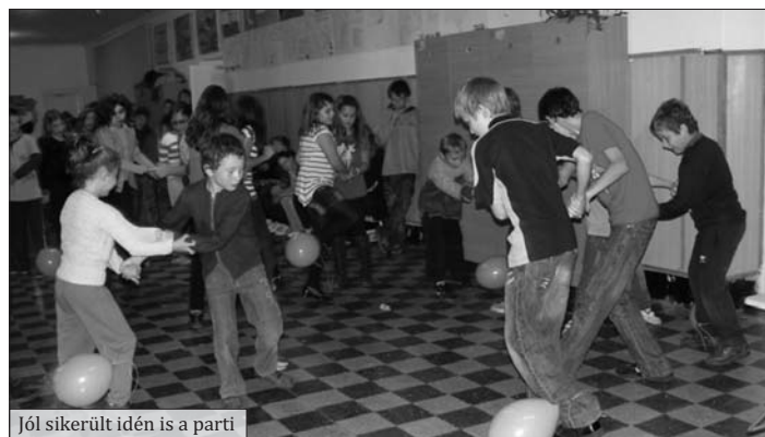
Jól sikerült idén is a parti

Október 17-én délután sokan visszajöttek az iskolába, hogy színes falevelekből, apró magvakból, bogyókból képeket készítsenek. Ilyenkor otthon lázas kutatás indul a konyhában, kamrában, kertben használható alapanyagok után. Hoztak a gyerekek mákot, pirospaprikát, teafüvet, babot, lencsét, tökmagot, és még sorolhatnám, hogy mi mindent. Sokan egyedül alkottak, mások párban, csoportban dolgoztak. Az elkészült műveket zsűri értékelt, és a legszebbekből kiállítást rendeztünk.