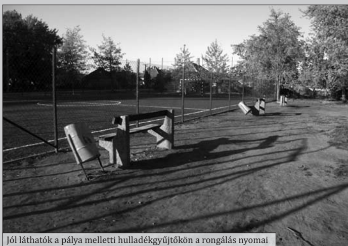
Jól láthatók a pálya melletti hulladékgyűjtőkön a rongálás nyomai