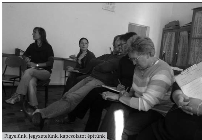
Figyelünk, jegyzetelünk, kapcsolatot építünk

A képek a civil szervezetek vezetőségi tagjainak meghirdetett „adománygyűjtő akció” továbbképzésen készültek.