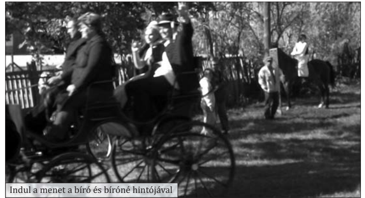
Indul a menet a bíró és bíróné hintójával

Köszönetet szeretnék mondani városunk lakóinak, vállalkozóinak, a lovasoknak, a Rendőrségnek és Polgárőrségnek, akik a 2011. október 15-én megrendezésre került Szüreti felvonulásunkon és a bálon részt vettek, valamilyen formában hozzájárultak a rendezvény sikeres lebonyolításához.