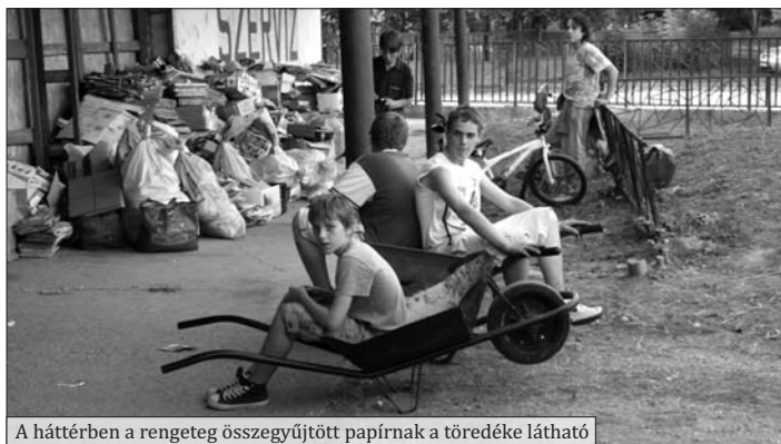
A háttérben a rengeteg összegyűjtött papírnak a töredéke látható

A PET palackokat az idén 30 Ft/kg-os áron veszi át tőlünk a DÉSZOLG Kft. (tavaly 20 Ft volt) Kérjük a város lakóit, hogy ne dobják ki a kukába műanyag palackjaikat! Tapossák össze, és egy nagy zsákba összegyűjtve hozzák be az iskolába! A portán ügyeletet ellátó gyerekek átveszik önkéntől.