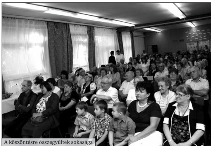
A köszöntésre összegyűltek sokasága