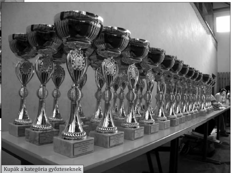
Kupák a kategória győzteseknek