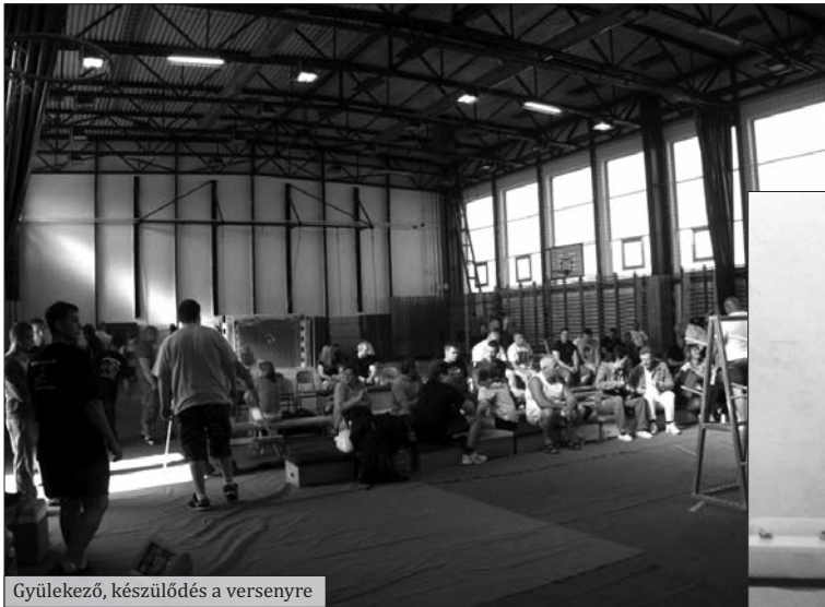
Gyülekező, készülődés a versenyre