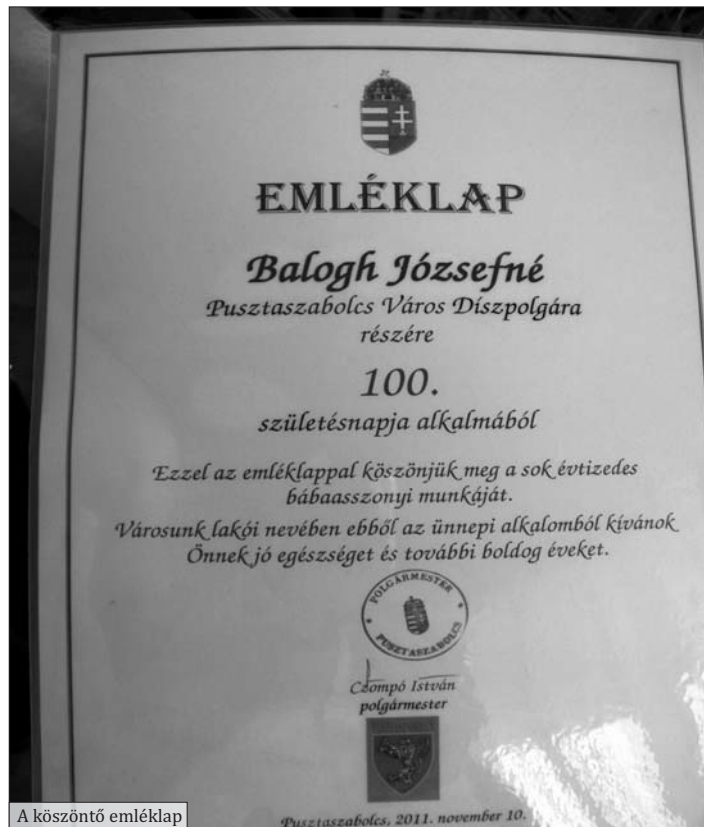
A köszöntő emléklap