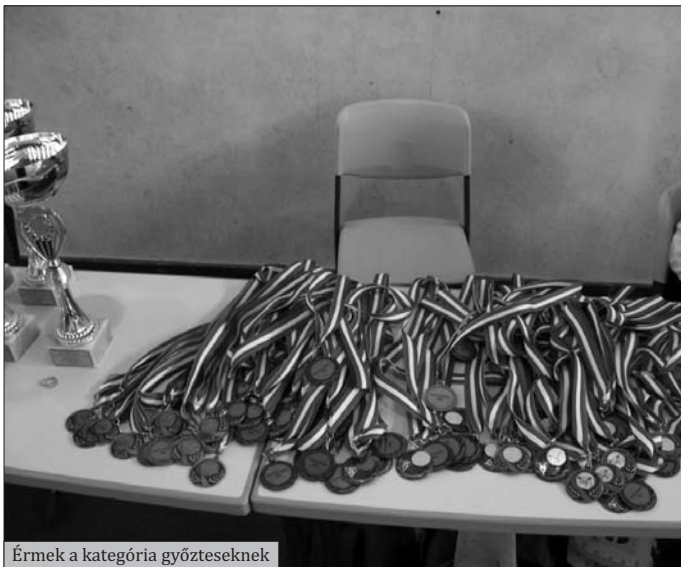
Érmek a kategória győzteseknek