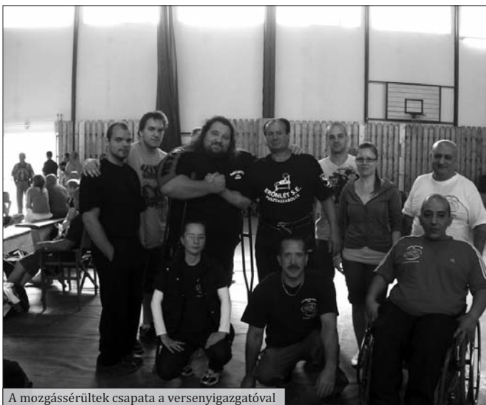
A mozgássérültek csapata a versenyigazgatóval