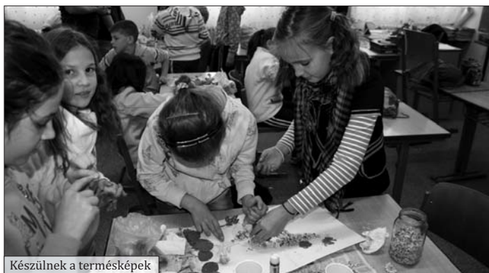
Készülnek a terméképek