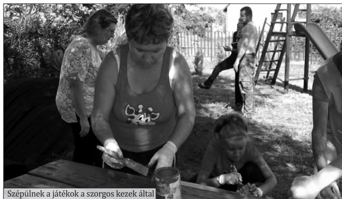
Szépülnek a játékok a szorgos kezek által