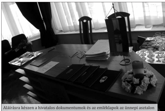
Aláírásra készen a hivatalos dokumentumok és az emléklapok az ünnepi asztalon