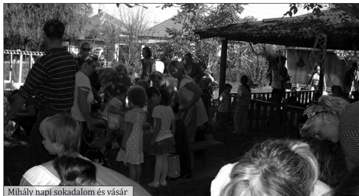
Mihály napi sokadalom és vásár