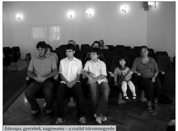
Édesapa, gyerekek, nagymama – a család háromnegyede

Mi, akik magyar állampolgárnak születtünk, talán fel sem tudjuk fogni, hogy mit jelent ez. Mit jelent az, hogy nemcsak kulturálisan tartozunk egy néphez, de valóban a magyar nemzethez tartozhatunk jogilag is. Becsüljük meg ezt, adjunk hálát az országunkért és dolgozzunk érte, mert „itt élned, halnod kell” – ahogy a Szózatban tanultuk.