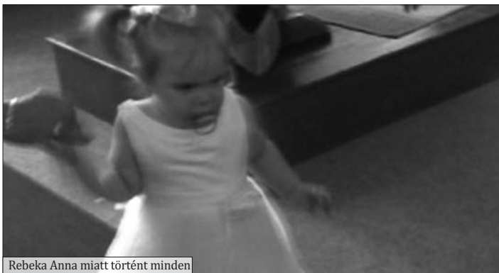
Rebeka Anna miatt történt minden

Hogy lehetne szavakba önteni A nyári reggel pompás színeit? Egy sajátos színkeverék: Tündöklő kék ég kékje, Sokszínű zöld, fű, fa zöldje, Tündöklő zöld remegő kékje, Rózsaszín levegő lila keveréke, Tündöklő sárga, napsugár aranya, Fátyolként öleli egybe, A reggel harmatos ékei. (saját vers)