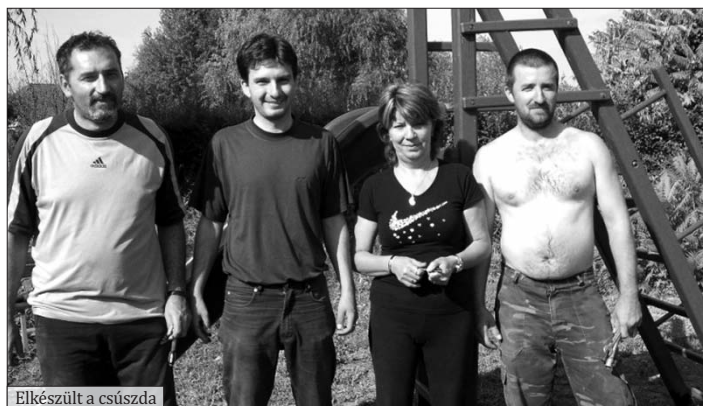
Elkészült a csúszda

Ezt a sok munkát elvégezni csak összefogással lehetett. Köszönet a szülőknak, dolgozóknak, minden segítőnek, és nem utolsósorban az Önkéntes Tűzoltóknak! Ezen a napon meg tapasztaltuk, hogy milyen jó érzés, ha egy kollektíva össze-