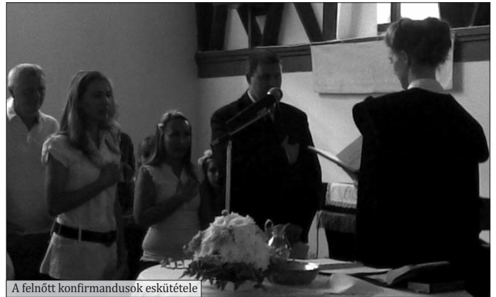
A felnőtt konfirmandusok eskütétele