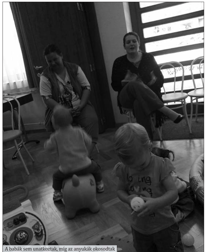
A babák sem unatkoztak, míg az anyukák okosodtak