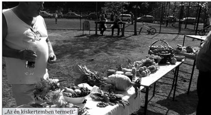
„Az én kiskertemben termett”