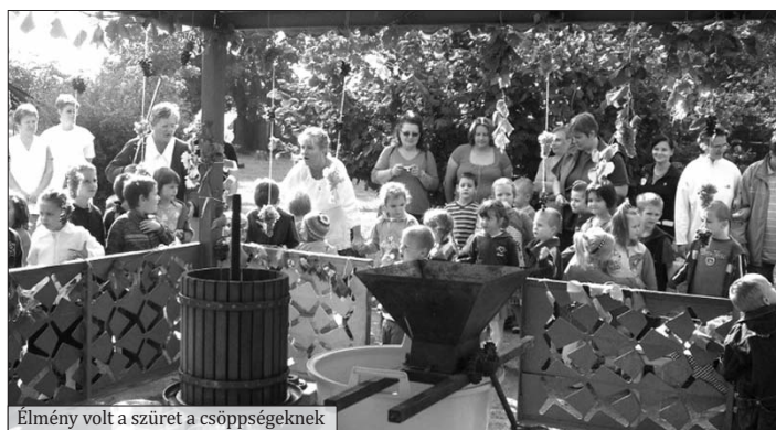
Élmény volt a szüret a csöppsegeknek

A Mihály napi vásáron a gyermekek, óvónők és szülők által készített portékákat lehetett megvásárolni almáért és dióért. Nagy volt a nyüzsgés, a gyermekek nagy izgalommal válogattak az áruk között és lelkesen vásároltak. Örömmel vitték haza a kincseiket az óvodások, a csoportoknak pedig