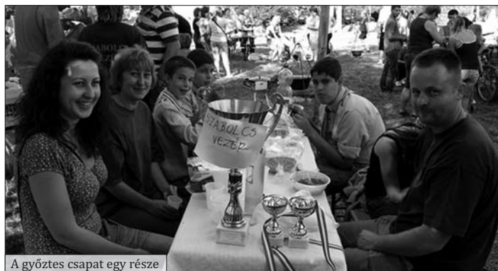
A győztes csapat egy része