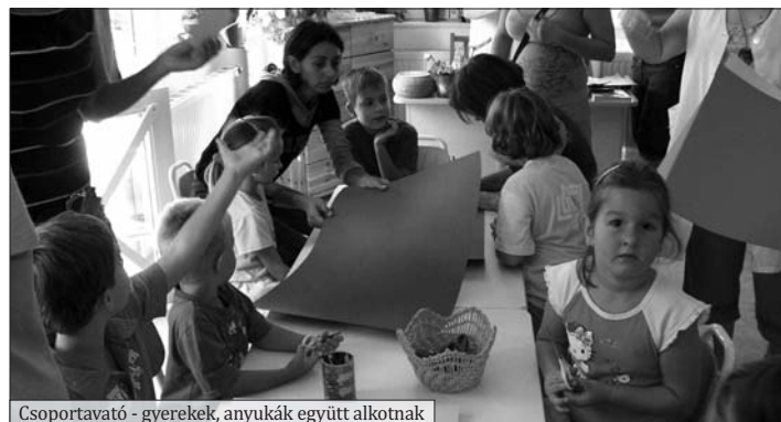
Csoportavató - gyerekek, anyukák együtt alkotnak