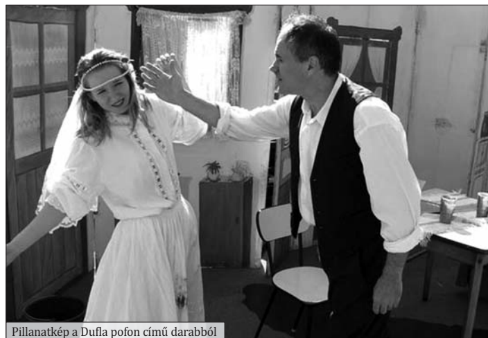
Pillanatkép a Dufla pofon című darabból