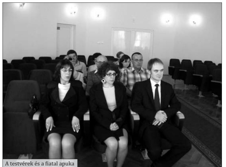
A testvérek és a fiatal apuka