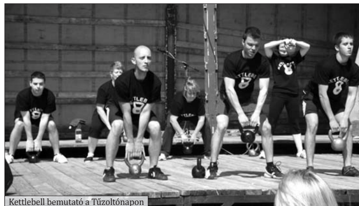
Kettlebell bemutató a Tűzoltónapon

Az izmok erősítésével, a testtartás javításával a gerincbántalmak is megelőzhetőek. Mindemellett gátolja a csontritkulást, tartósan emelkedik a nyugalmi alapanyagcsere.