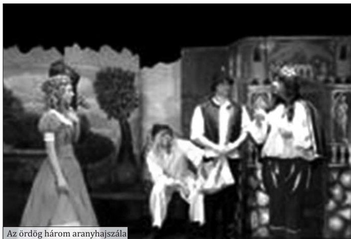
Az ördög három aranyhajszála

A társulat ezen előadása az idén tavasszal, a Budapesti Fesztiválközpont által megrendezett Fringe Fesztiválon a Közönség Díjat és a fesztivál Különdíját kapta.