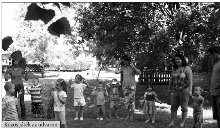
Közös játék az udvaron

Már nagyon izgatottan vártam, hogy nálunk a Zsiráf ovi-ban és a mi csoportunkban, amit úgy hívnak, hogy Hold csoport, legyen már ez a csoportavató nap. Tudtam, hogy itt lesz velem az anyukám és a barátainak is jönnek a szülei és majd megnéznék bennünket, hogy miket tudunk már, hogy milyen ügyesek vagyunk, hogy hogyan viselkedünk, és hogy együtt játszunk egy kicsit.