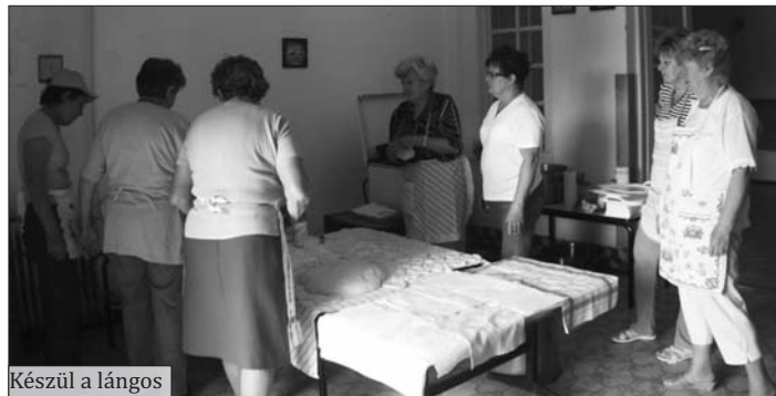
Készül a lángos

Mindeközben készült a lángos a harmóniás asszonyok keze alatt, amihez az alapanyagot bedagasztva, megkelesztve