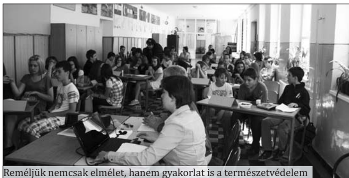
Reméljük nemcsak elmélet, hanem gyakorlat is a természetvédelem

Óvjuk környezetünket! címmel a DÉSZOLG Kft. ÖKO játszóházába vártuk az alsó tagozatos diákokat. Az iskola udvarán felállított hatalmas sátor már ismerős volt a gyerekeknek, mert tavaly is jártak nálunk. A tematikus és ügyességi játékok akkor és most is sok érdeklődőt vonzottak. Játssza tanulni sokkal könnyebb és érdekesebb, mint a tanítói magyarázatot hallgatva. Észre sem vették, hogy mennyi mindent megtudtak a szelektív hulladékgyűjtésről, az újrahasznosításról, a növények és állatok védelméről, a levegő és a vizek tisztaságának megővéséről.