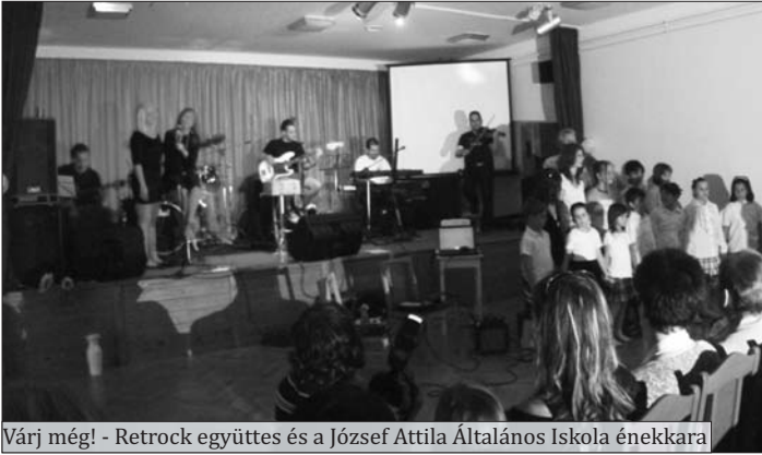
Várj még! - Retrock együttes és a József Attila Általános Iskola énekkara

A József Attila Általános Iskola énekkarának műsora is nagyon tetszett, jó lenne még nagyon sokat hallani róluk. Gyönyörű hangja van a két szólóénekes kislánynak.