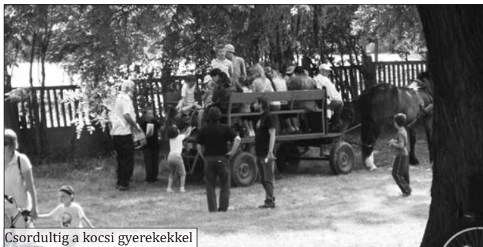
Csordultig a kocsyi gyerekekkel