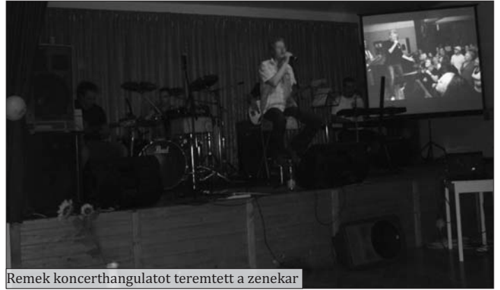
Remek koncerthangulatot teremtett a zenekar

Pusztaszabolcs környékén nem volt a zenekar még hasonló jellegű, és színvonalban vetekedő eseményen. Köszönjük szépen a meghívást, a valamint a kedves meglepetést, az ajándék pólókat a Napraforgó Klubnak!