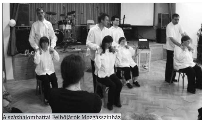
A százhalombattai Felhőjárók Mozgásszínház

Minden elismerést megérdemel a vezetőjük is.