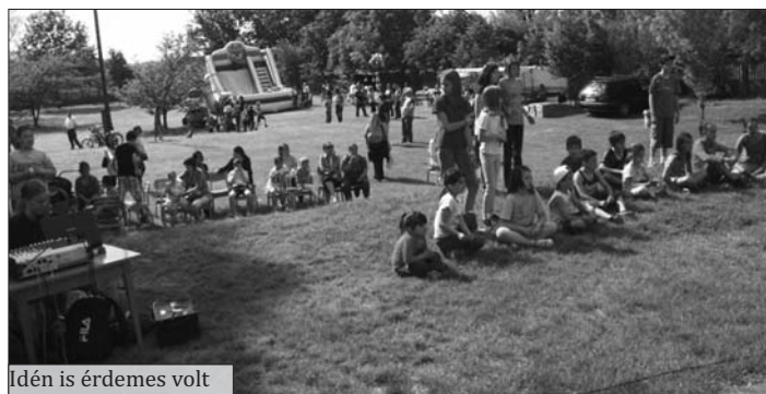
Idén is érdeemes volt